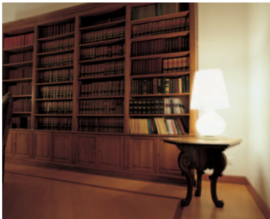
Studio Gilioli, Alemani, Bocchiola, Tamburini e Partners - Milano